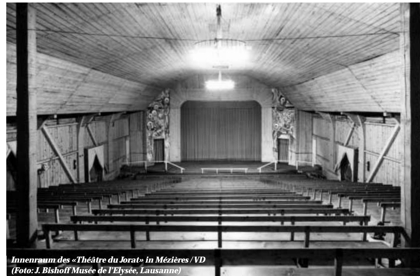
Innenraum des «Théâtre du Jorat» in Mézières /VD

*ASTEJ, ktv, SADS, SBKV, UNIMA Suisse, VTS, IGTZ und Tanzhaus Wasserwerk unterstützen ihre Mitglieder mit einem Kurskostenbei-