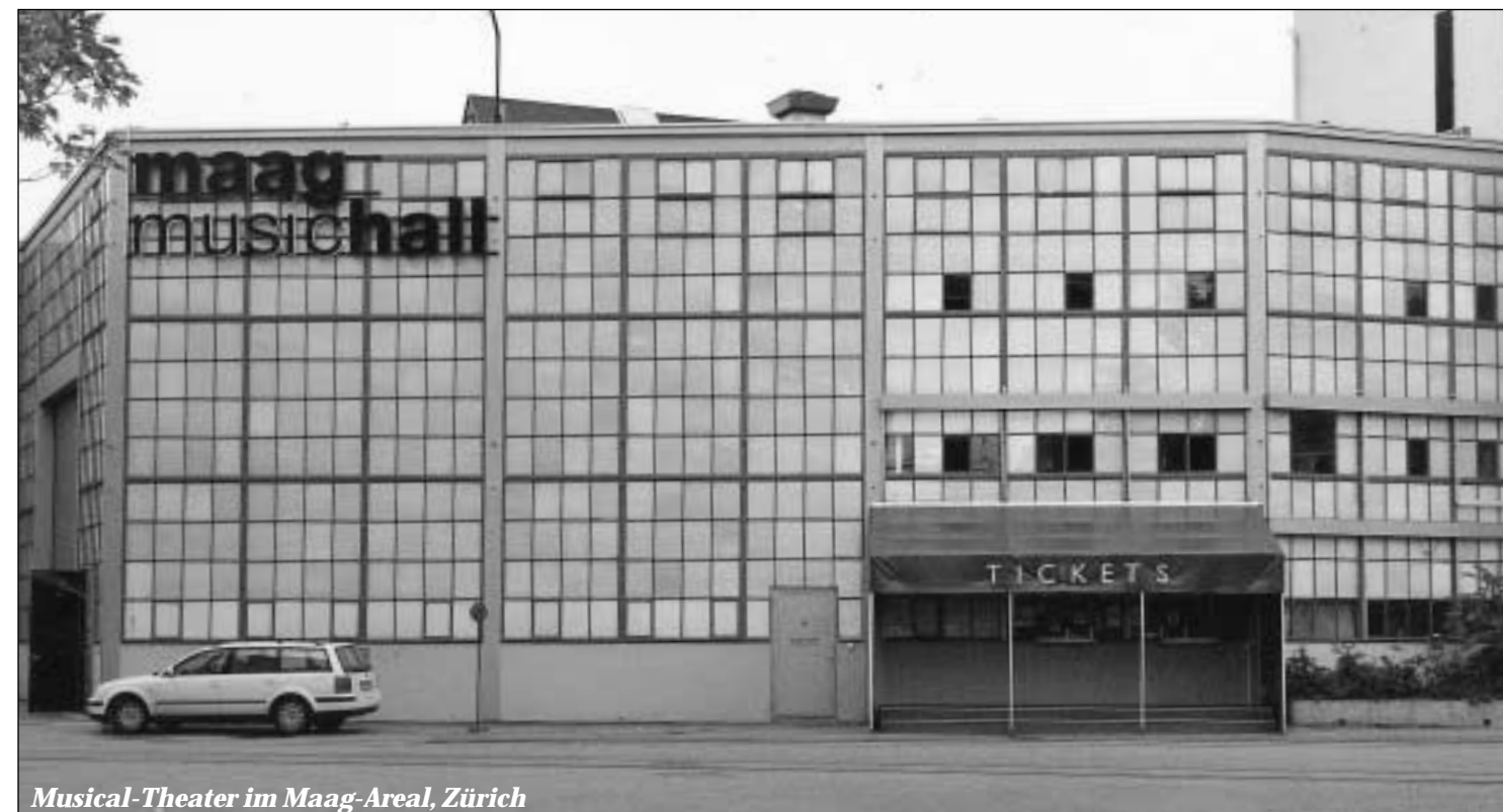
Musical-Theater im Maag-Areal, Zürich