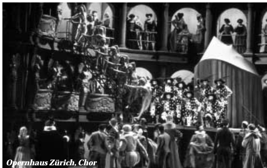
Opernhaus Zürich, Chor

sätzlich ist eine gute Stimme das «Grundkapital» für jedes Sängerleben – ganz gleich ob als Star der internationalen Opernszene oder innerhalb eines Chorkollektivs. Auch die Ausbildung ist weitgehend identisch. Die Anforderungen an die Beherrschung der Gesangstechnik, das stimmliche und körperliche Durchhaltevermögen sowie die Wandlungsfähigkeit der Stimme sind aber, genau betrachtet, für Chorsängerinnen und Chorsänger strenger als für Solisten: Sie werden vom Spielplan und vom jeweiligen Betrieb definiert und nehmen kaum Rücksicht auf die individuellen Charakteristika der Einzelnen. Im Chor muss jeder, unabhängig vom Naturrell seiner Stimme und von der Eignung für ein bestimmtes Repertoire, das ganze Spektrum vom Barock bis zur Moderne, vom wagnerisch-heroischen Drama bis zur leichten Operette bestreiten. Und das in ganz zufälliger Reihenfolge jeden einzelnen Abend. Und bis zum Pensionsalter. Solistinnen und